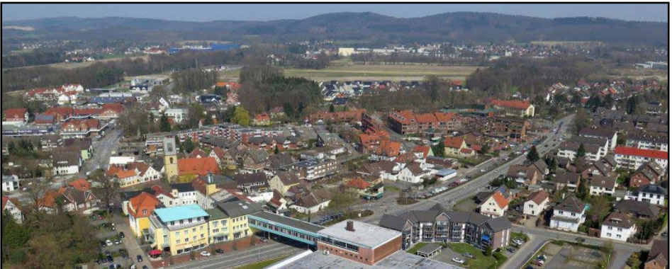
Steinhagen aus der Luft:

persönliche Kontakte zu unserem Bürgermeister gesucht oder auch zu meiner Bundestagsabgeordneten – und sie hat mein Anliegen aufgenommen und unterstützt. Es lohnt sich also, nicht den Rückwärtsgang als Christen einzulegen (also Rückzug), sondern den Vorwärtsgang: „Suchet der Stadt Bestes!“ geht eben nur im Vorwärtsgang. Ich habe Erfahrungen gemacht, dass man dabei keine Angst um den eigenen Glauben haben muss, als käme der dadurch in Gefahr. Ob das auch für dich eine Art Motto für deine Motivation werden kann, in deiner Stadt/Dorf zu leben? Mich fordert dieses Bibelwort zu Aufmerksamkeit heraus. Ich kann nur das finden, was der Stadt und ihren Menschen das Beste ist, wenn ich aufmerksam mit meinen Mitmenschen zusammen lebe, um zu entdecken, was sie wirklich brauchen. Vielleicht ist es einfach nur ein bisschen mehr Zeit